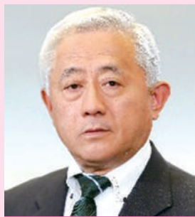
会長 Председатель Координационного совета

学校法人朴沢学園 理事長 Президент Образовательной Корпорации (Ходзава Гакуэн)