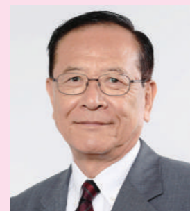
立川市長 Мэр г.Тачикава

В заключение хочу еще раз выразить глубокую благодарность всем членам Координационного совета за проделанную ими огромную работу и выразить надежду, что настоящий юбилейный журнал послужит еще одним важным вкладом в дело развития дружбы.