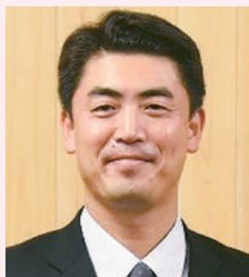
副会長 Вице-председатель Координационного совета

В заключение хочу еще раз сказать слова огромной благодарности организаторам тренировочных лагерей, общественным организациям и волонтерам за их большой труд и поддержку на протяжении длительного периода с момента старта проекта до успешного завершения Олимпийских Игр.