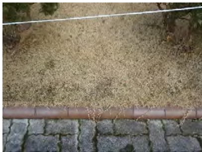
写真1. 噴水まわり芝生 寒地型雑草が目立つ 【近景】