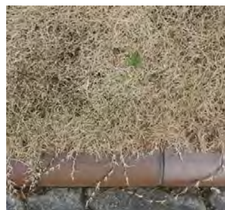
写真2. 噴水まわり芝生 寒地型雑草が目立つ 【接写】