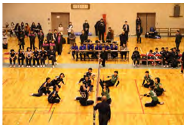
プレーやルールの解説も行われ、よりシッティングバレーボールの魅力が分かる試合となりました