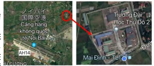
ハノイ首都大学スポーツ健康科学学部キャンパス

昨年11月に同大学訪問の際、同大学の教育学部学生の仙台大学大学院受入および同大学に新設されたスポーツ健康科学学部との交流等に関して打合せを実施し、これに基づき、ハノイのノイバイ国際空港近辺に整備されたスポーツ健康科学学部キャンパスを視察の上、国際交流協定締結に向けた動きとなりました。