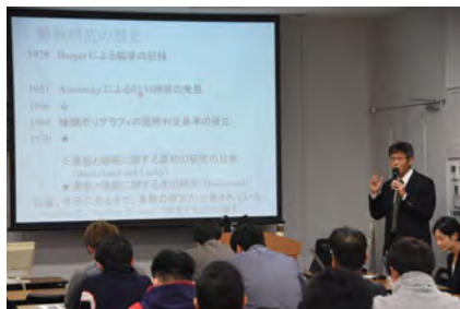
講演①「睡眠と運動・スポーツ」