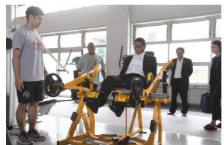
トレーニングを体験する様子