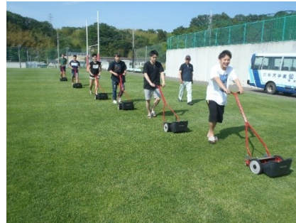
<写真6>手引き式リールモア (10台) による実習