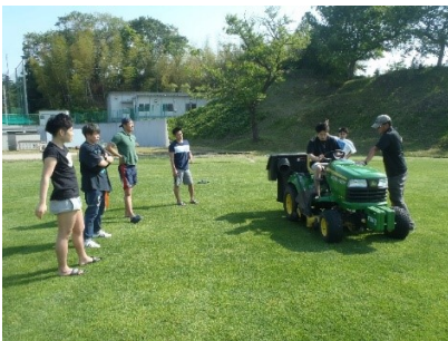
<写真7>乗用3連ロータリーモア草刈り機操作