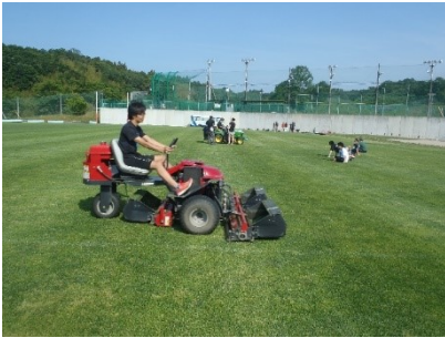
<写真5> 乗用3連リールモア草刈り機操作 後方にロータリーモアグループ 最後方に手引き式リールモアグループ