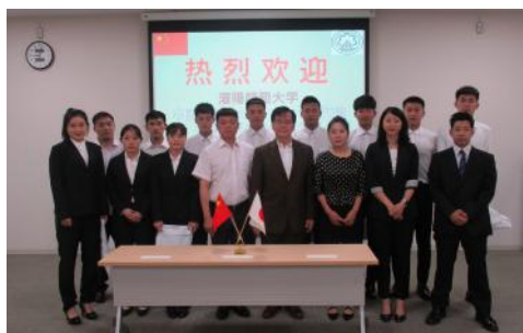
本学LC棟にて歓迎後、記念写真