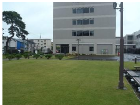
<写真2> Bブロック草刈り後開放