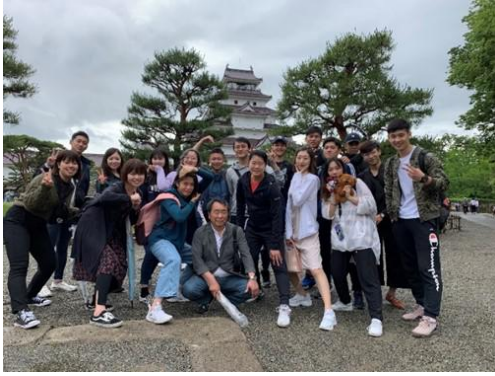
鶴ヶ城前にて記念写真