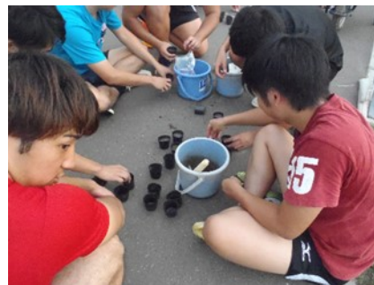
<写真8>ポットに寒地型種を播種して生育を観察