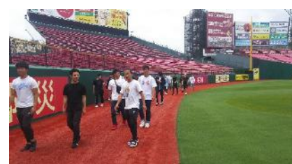
<写真3> 球場内を移動しながら天然芝生の生育を確認

6月23日（日）に楽天生命パーク宮城において「スポーツ施設管理概論」及び「スポーツターフ管理概論」の授業の補講として施設見学会が行われました。