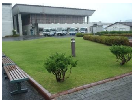
<写真3> Cブロック草刈り後開放