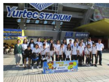
ベガルタ仙台サッカー観戦