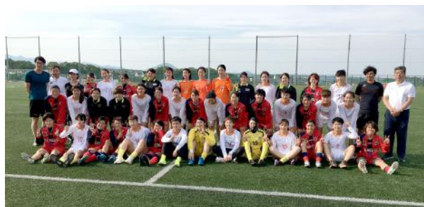
明仙フィールド川平にて記念写真