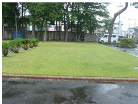
<写真1> Aブロック草刈り後開放