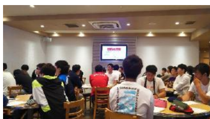
<写真2> 経営理念などマネジメントの講義