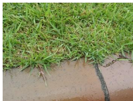
<写真4> 匍匐茎伸長状況