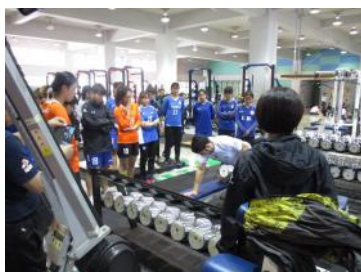
トレーニングセンターにて講義を受ける様子