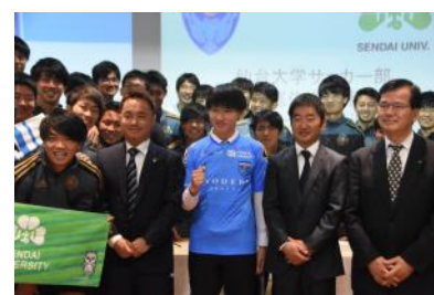
内定会見時、サッカー部員から祝福を受けた後、記念写真