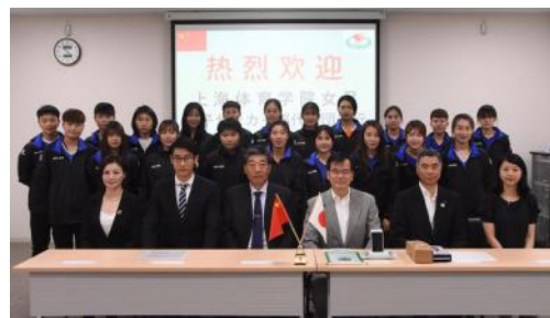
本学LC棟にて歓迎後、記念写真

5月26日（日）から6月5日（水）まで、上海体育学院女子サッカー部の学生20名と引率者3名が本学に来訪しました。