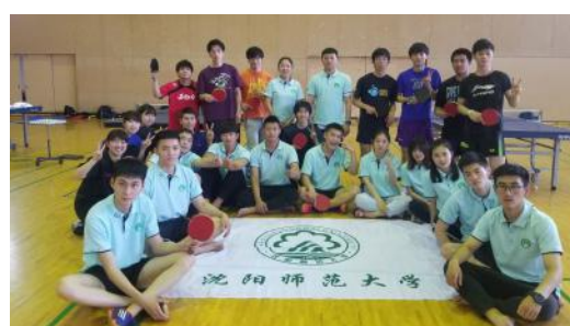
卓球交流後、記念写真

6月12日（水）から6月18日（火）まで、瀋陽師範大学の学生12名と引率者2名が中国伝統スポーツ・文化体験プログラムのため本学に来訪しました。今回のプログラムでは、剣道・空手・卓球等の実技や基本的な日本語の講義等を実施しました。また、本学授業の一環として、瀋陽師範大学の学生が、現代武道学科1年生約50名に対し、中国武術パフォーマンス演技を披露しました。演技終了後には、瀋陽師範大学の学生が、本学学生に中国武術について指導を行い、実りある学生間国際交流になりました。