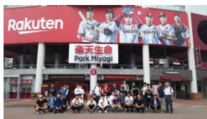
<写真1> 正面玄関にて集合写真