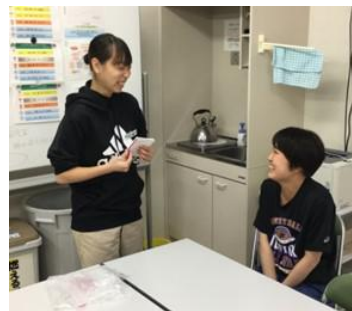
②写真左：AT学生、右：高校生