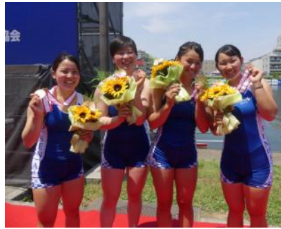
女子クォド 3位 (学生1位)