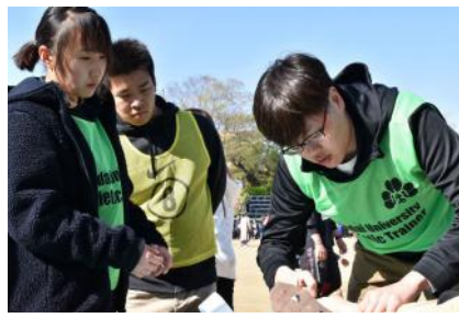
200名のケアを行うAT部の学生の様子