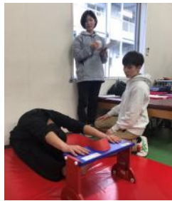
測定員として取り組む本学学生の様子