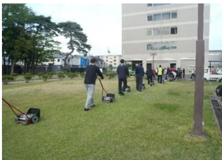
<写真1>手引き式リールモア草刈り機(10台)による実習<Bブロック>