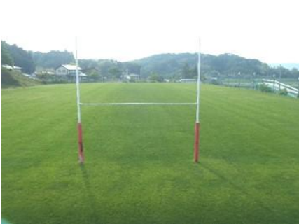
<写真4>寒地型芝生全景<ラグビー・アメリカンフットボール場東側>