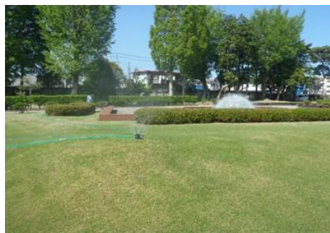
<写真2>移動式小型スプリンクラーによる散水<Cブロック>