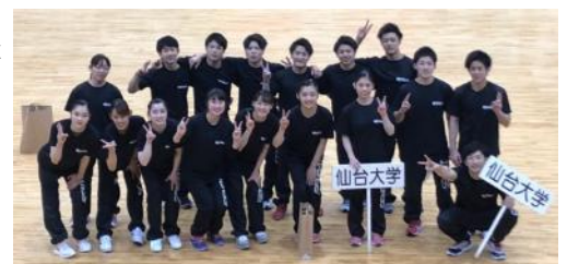
東日本インカレで活躍を見せた仙台大の男女体操陣。個人枠で出場した選手も含めて「ハイ、ポーズ！」