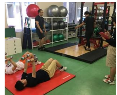
③S&C指導を見学するAT学生(写真右)