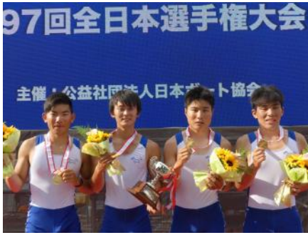
男子舵手なしフォア 優勝