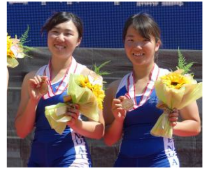
女子軽量級舵手なしペア3位

5月23日（木）から5月26日（日）に戸田ポートコースにて行われた、第97回全日本選手権大会で、男子舵手なしフォアが日本一の快挙。また多くの種目で入賞しました。