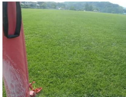
<写真5>寒地型芝生遠景<ラグビー・アメリカンフットボール場東側>