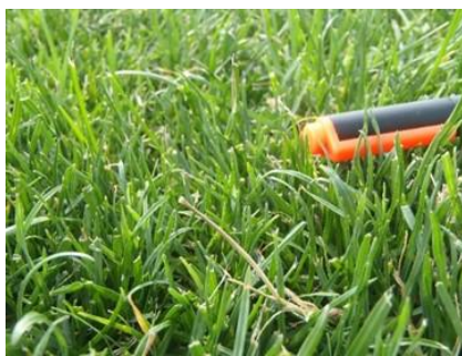
<写真7>寒地型芝生接写 <ラグビー・アメリカンフットボール場東側>