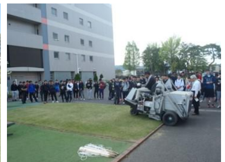
<写真3>乗用スーパーによる刈り粕等の清掃実演<Putting Green ブロック>