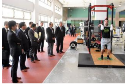
トレーニングセンターやATルームを視察された様子