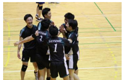
試合中声を掛け合う様子