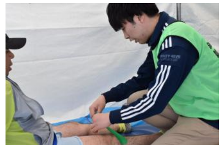
今年も多くの方々のご利用いただき、取り組む学生たちの様子