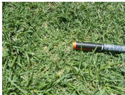
<写真8>暖地型芝生(パミュダグラス)接写<ラグビー・アメリカンフットボール場東南角>