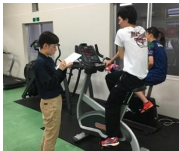
①写真左：AT学生、右：高校生

我々川平ATRの活動理念の一つとして「高校スポーツの安全を守る」を掲げておりますが、そんな我々の理念に共鳴する未来の専門家(ATやS&Cコーチ)の育成や輩出も、我々川平ATRにとっての重要な役割の一つです。社会にとって有益な専門家が普及していくことは、日本が抱える健康やスポーツの抱える各種問題解決の一端を担うと信じ、川平ATRの活動を今後も精進していこうと思います。