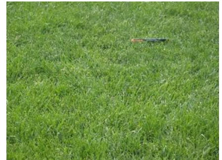
<写真6>寒地型芝生近景<ラグビー・アメリカンフットボール場東側>