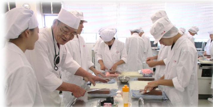
※こちらの写真は2018年の様子です。

今年度も新入生は貸与された包丁を手にし、後期から始まる調理実習に向けて意気込んでいる様子が見られました☺ 引き続き、感染対策を行いながらの調理実習となりますが、衛生管理も栄養士を目指す皆さんにとって必要な知識です。座学で学んだ知識を調理実習で活かすことで、より栄養に関する理解を深めます。