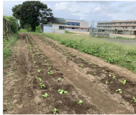
本学科から栄養教諭取得を目指す学生2名、高校から1名が参加（写真左）。教わった白菜の苗の植え方をサポートしながら、児童への接し方などを体験（写真中央）。定植が終わった畑（写真右）。