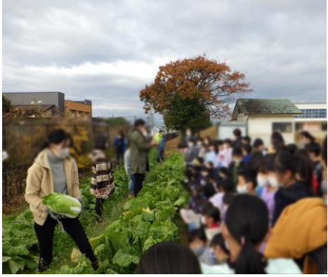
大きく育った白菜（写真左）。白菜の選び方を教えながら、児童への接し方などを体験（写真中央、学生は左の女性）。白菜の選び方や収穫の方法を説明しているところ（写真右）。